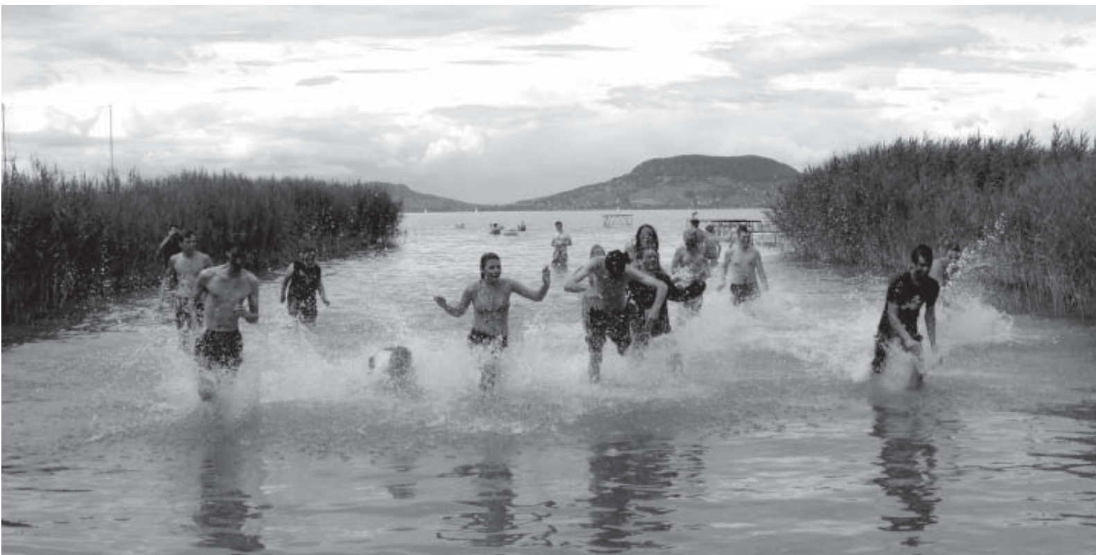
Fotó: Csatári Marianna ↓