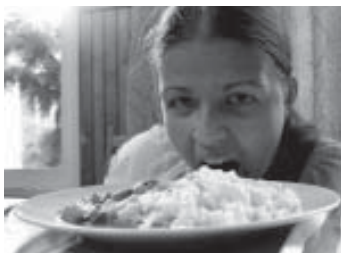
Fotó: Borossay Fanni