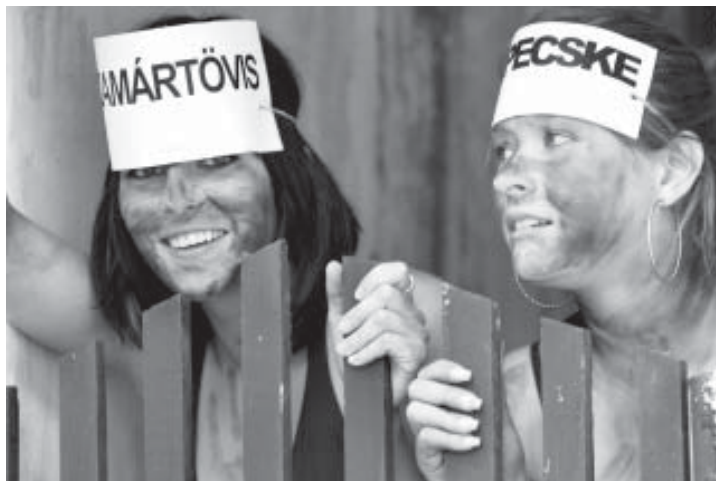
Fotó: Pétervári Petra →