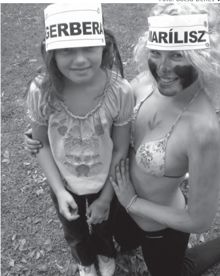
Fotó: Bacsu Dénes ↓