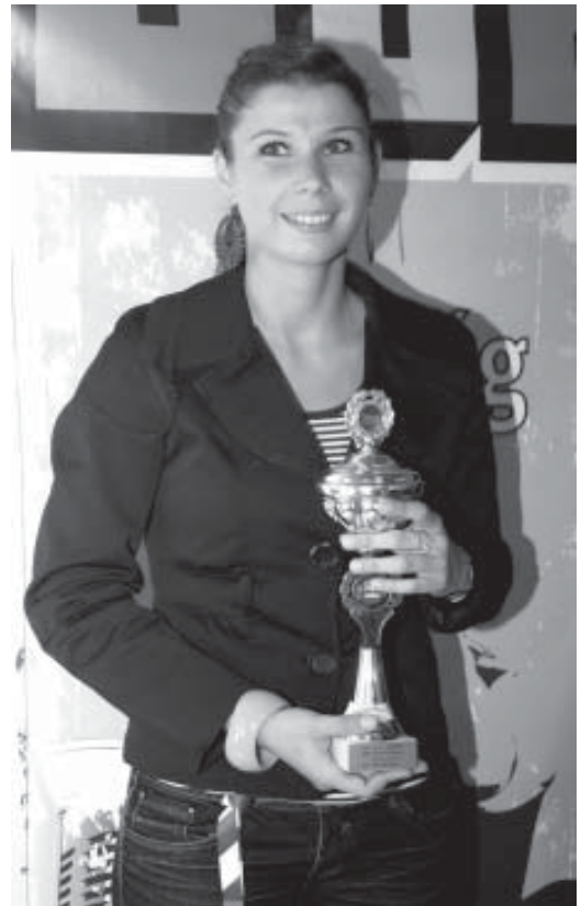
A legtáborabb ember