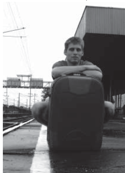
Összeállította: Csató Márton